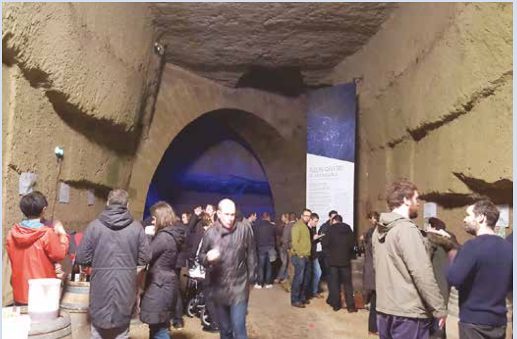
Les Caves Ackerman