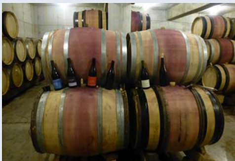
Domaine Alain Graillet et Equis