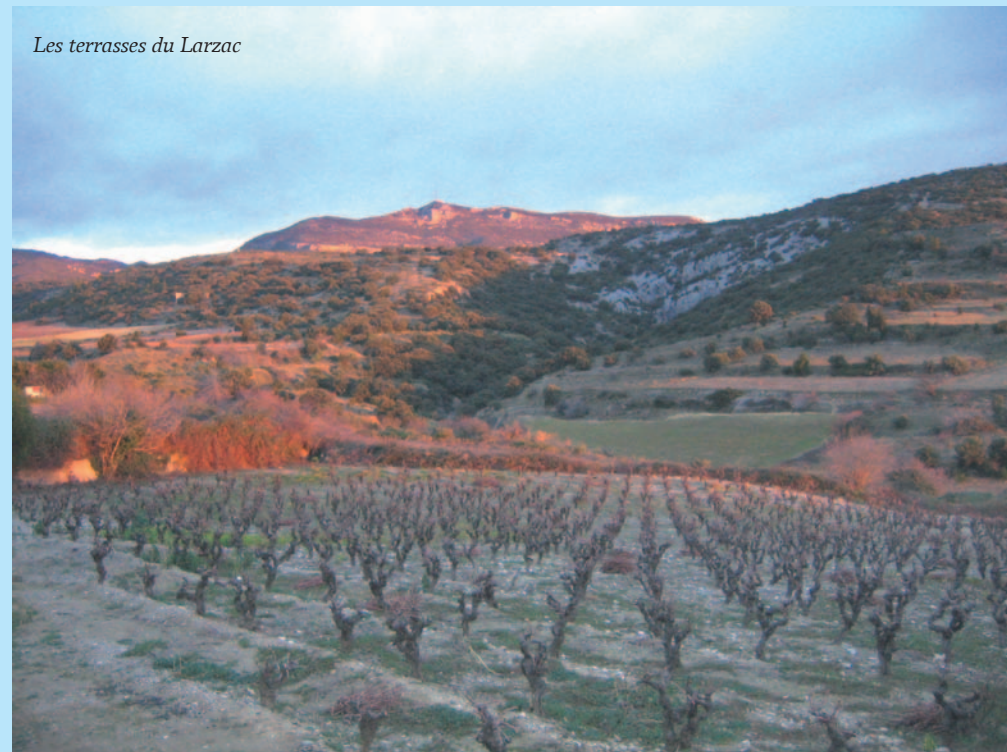
Les terrasses du Larzac