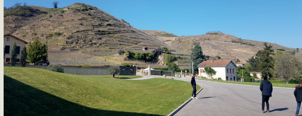
Vignoble des Côte Rôtie

Mauves, ce sont les appellations Saint-Péray, Cornas et Saint-Joseph qui sont mises à l'honneur. « Saint-Joseph à nouveau ? » vous me direz. Et oui, l'appellation faisant plus de soixante kilomètres de long, les vigneron ont choisi Ampuis ou Mauves selon leur situation géographique.