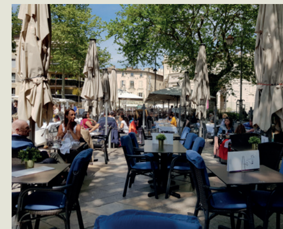
Place de l'Horloge à Avignon

Contrairement au nord où les salons se déroulent dans différents endroits,