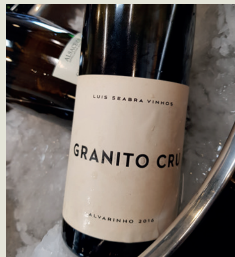
Un excellent Vinho Verde

ce jour-là. Organisé par les Graillot Père et Fils , il se tenait dans une jolie chapelle de Tournon. Les Graillot avaient invité quelques uns de leurs amis vigneron européens, américains et de l'hémisphère sud. Beaucoup de vins très intéressants qui auront toute mon attention dans les années qui suivent !