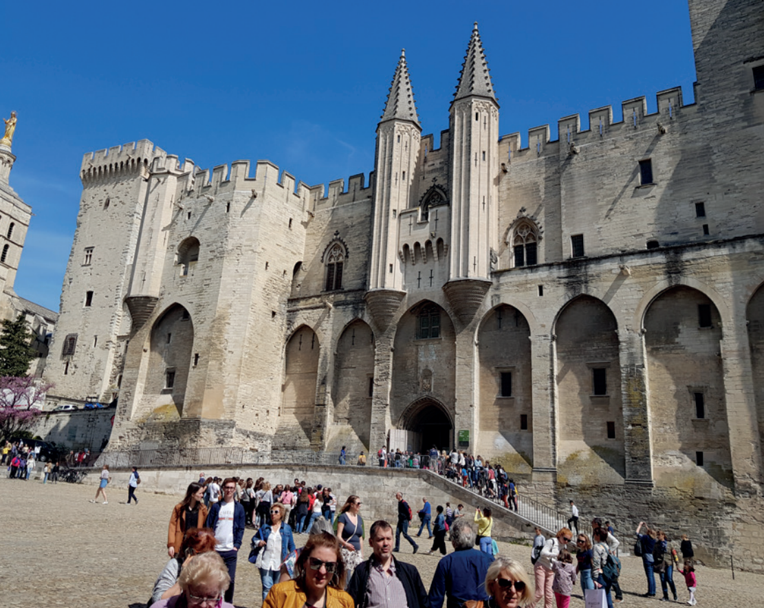
le Palais des Papes

dans le sud, les dégustations se tiennent dans un endroit majestueux, le Palais des Papes ! Aujourd'hui, c'est le Vaucluse qui est à l'honneur. Les vigneron de Gigondas, Vacqueyras, Cairanne, Rasteau, Beaumes de Venise, Sablet, Roaix, ...etc... sont au rendez-vous. Sauf les vigneron de Châteauneuf qui ont, depuis le début, toujours snobé ce beau rendez-vous bisannuel !