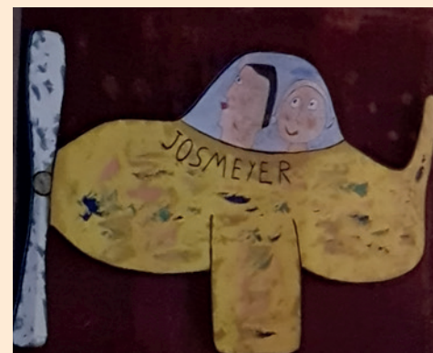
le «Yellow submarine volant»

Le deuxième jour nous remonterons vers chez Etienne Loew . Chez lui aussi