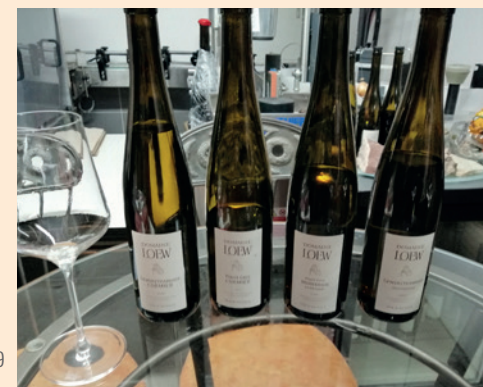
les vins d'Etienne Loew