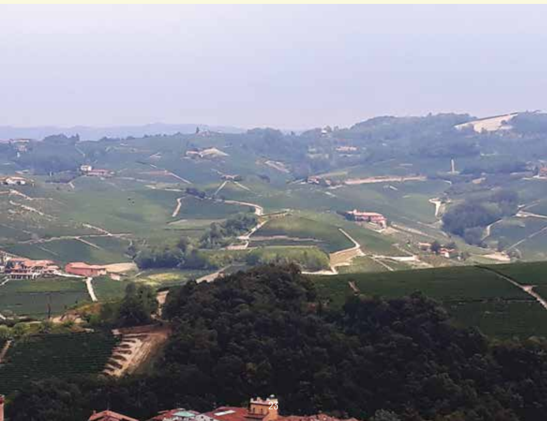
Vignoble de Barolo