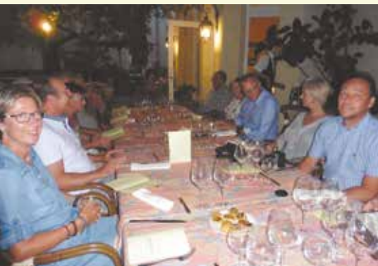
A la Beaugravière

Et bien sûr, une adresse incontournable que j'ai fait découvrir à mes amis en début de voyage, La Beaugravière à Mondragon.